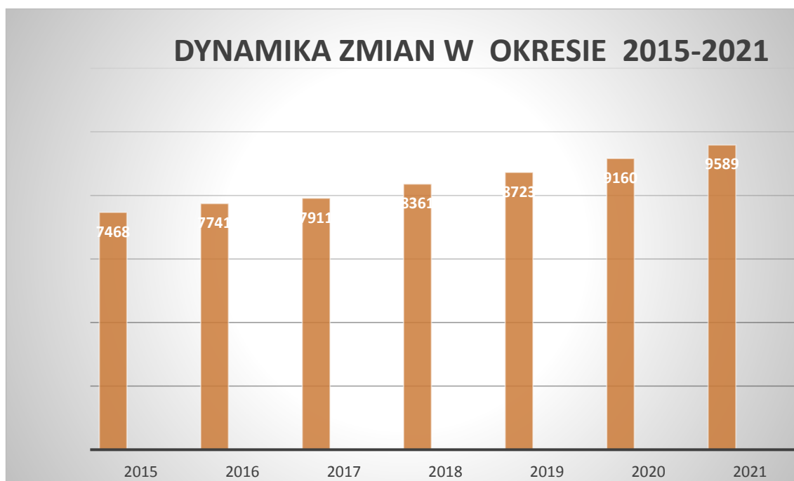
Dynamika zmian liczby mieszkańców Gminy Kleszczewo w latach 2015-2021

Wpływ na liczbę ludności w gminie, oprócz przyrostu naturalnego ma również saldo migracji.