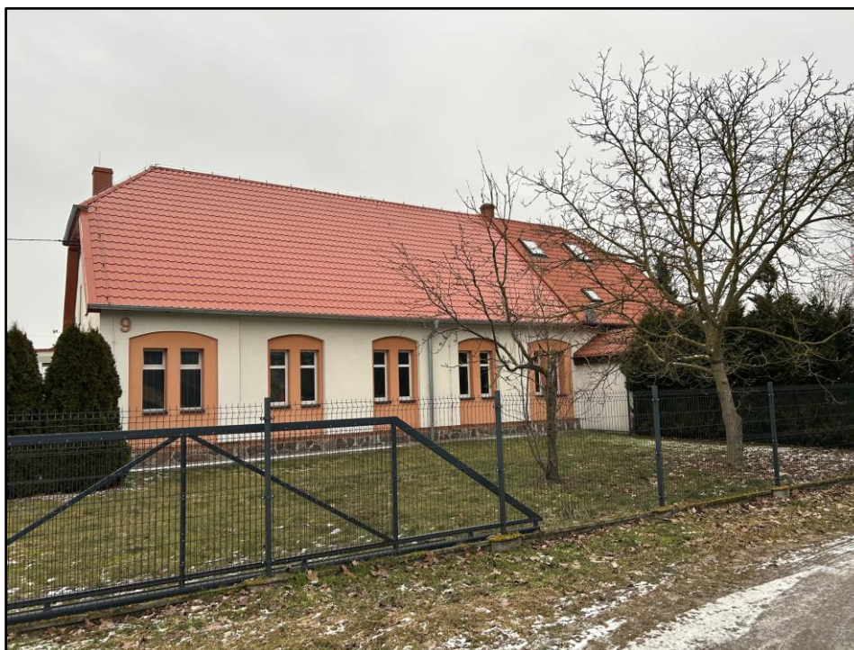
Budynek dawnej szkoły