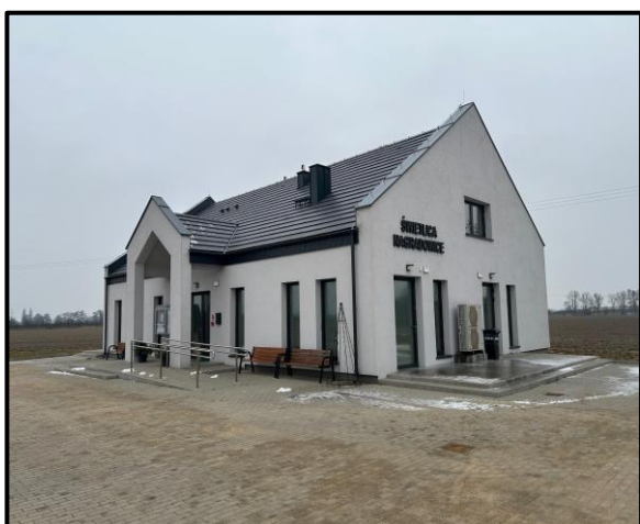
Świetlica w Nagradowicach