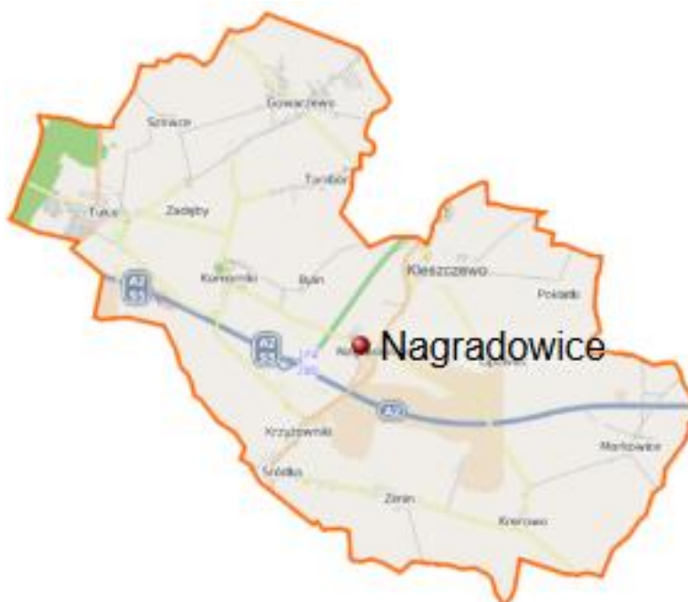
Położenie sołectwa na mapie gminy Kleszczewo