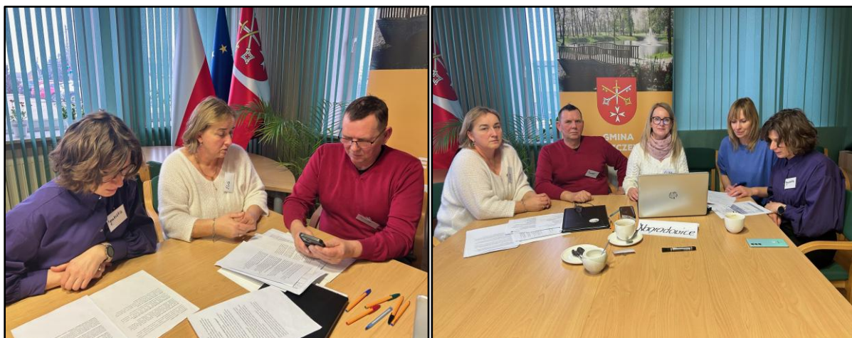
Uczestnicy warsztatów w trakcie opracowania Sołeckiej Strategii Rozwoju Urząd Gminy w Kleszczewie w dniach 30-31.01.2026 r.

Strategia odzwierciedla ideę odnowy wsi jako procesu społecznego, w którym najważniejszym podmiotem są mieszkańcy – inicjatorzy i realizatorzy działań na rzecz swojej miejscowości.