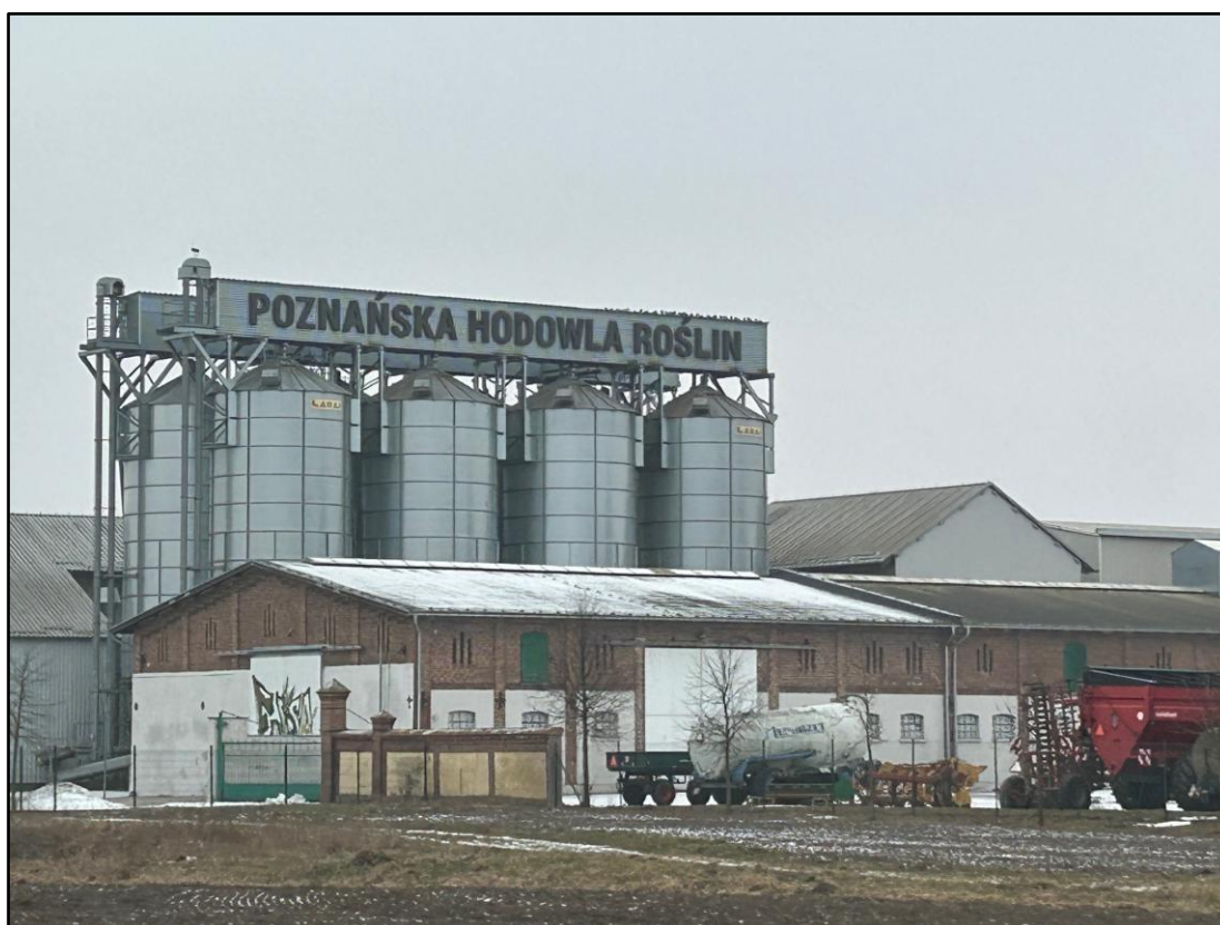
Stacja Hodowli Roślin – Magazyn Nagradowice

16. Moda osiedlania się na terenach wiejskich, w bliskości do większych aglomeracji. B