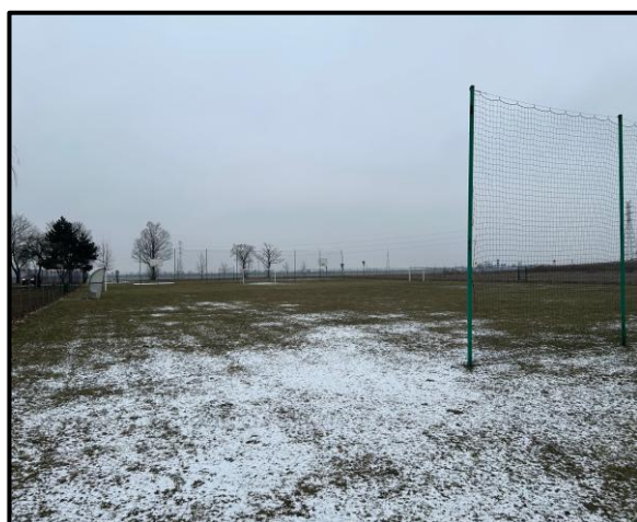
Miejsce sportu i rekreacji